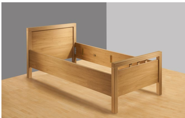
Ihr vorhandenes Einzel- oder Doppelbett

Ausgestattet mit den Funktionen eines Pflegebettes ersetzt der Betteinsatz sanlift die Liegefläche einer der beiden Seiten des bestehenden Doppelbettes. Der Betteinsatz bietet dem Patienten und den betreuenden Personen den Komfort eines Pflegebettes - und der zu Pflegenden kann in seiner gewohnten häuslichen Umgebung verbleiben.