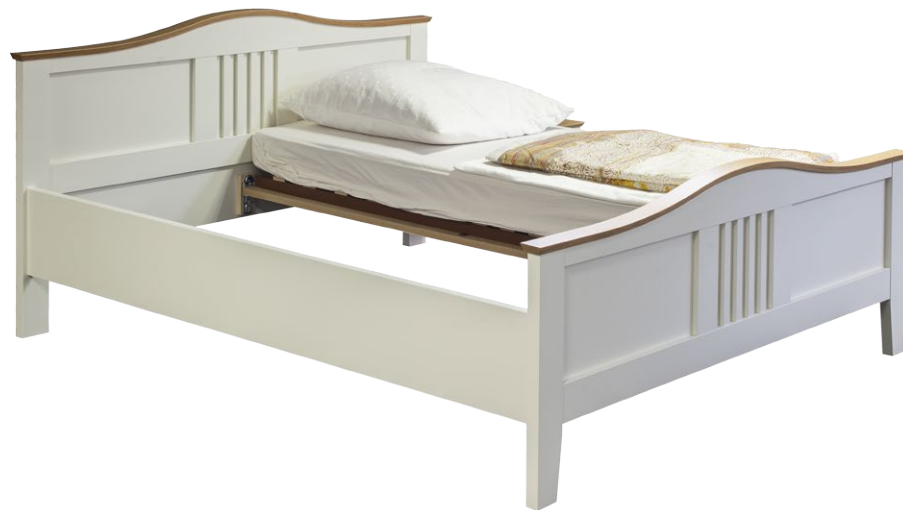
Kinderleichter Einbau von sanlift in ein bestehendes Doppelbett