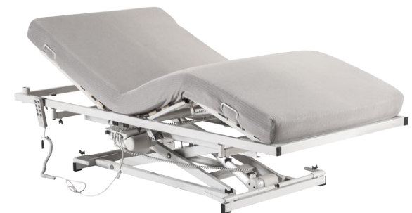
Verstellung von Kopf- und Fußteil