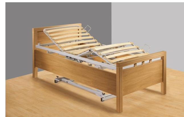
wohnliches Bett mit vielfältigen Funktionen für die häusliche Pflege